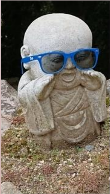
Ile Istukushima - Baie de Hiroshima