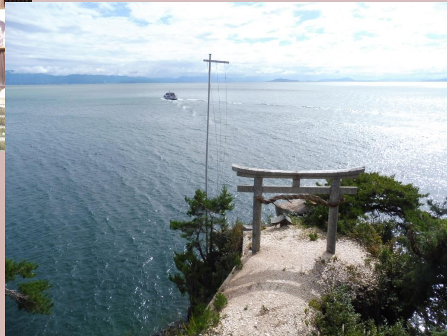
Nord du lac Biwa, Nord de Kyoto