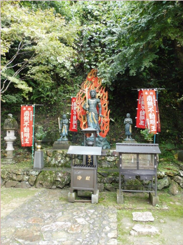
Nord du lac Biwa, Nord de Kyoto